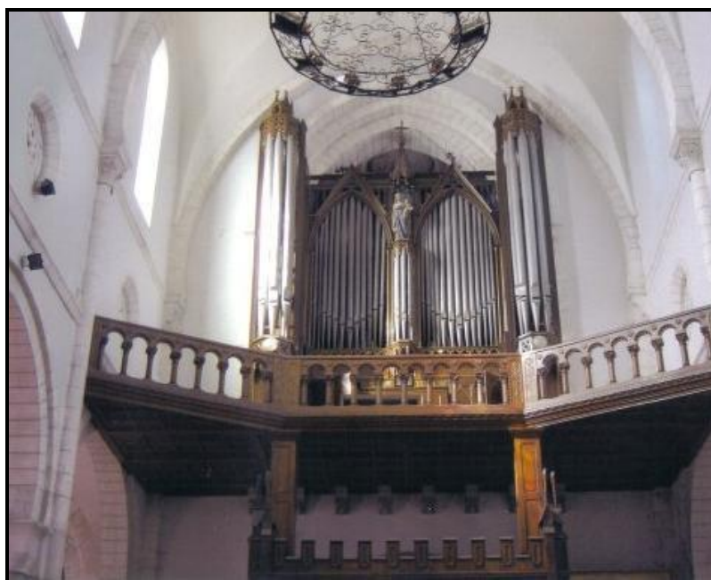
OLORON-SAINTE-MARIE : Eglise Notre-Dame 24 jeux – II/Péd

Orgue construit par Jules Barthélémy Magen d' Agen en 1867 et classé Monument Historique en 2009. En 2011-2012, la Manufacture Languedocienne de Grandes Orgues restaure complètement l'instrument en supprimant les ajouts de 1964. Inauguration, le 17 octobre 2012 par Jean-Claude Guidarini.