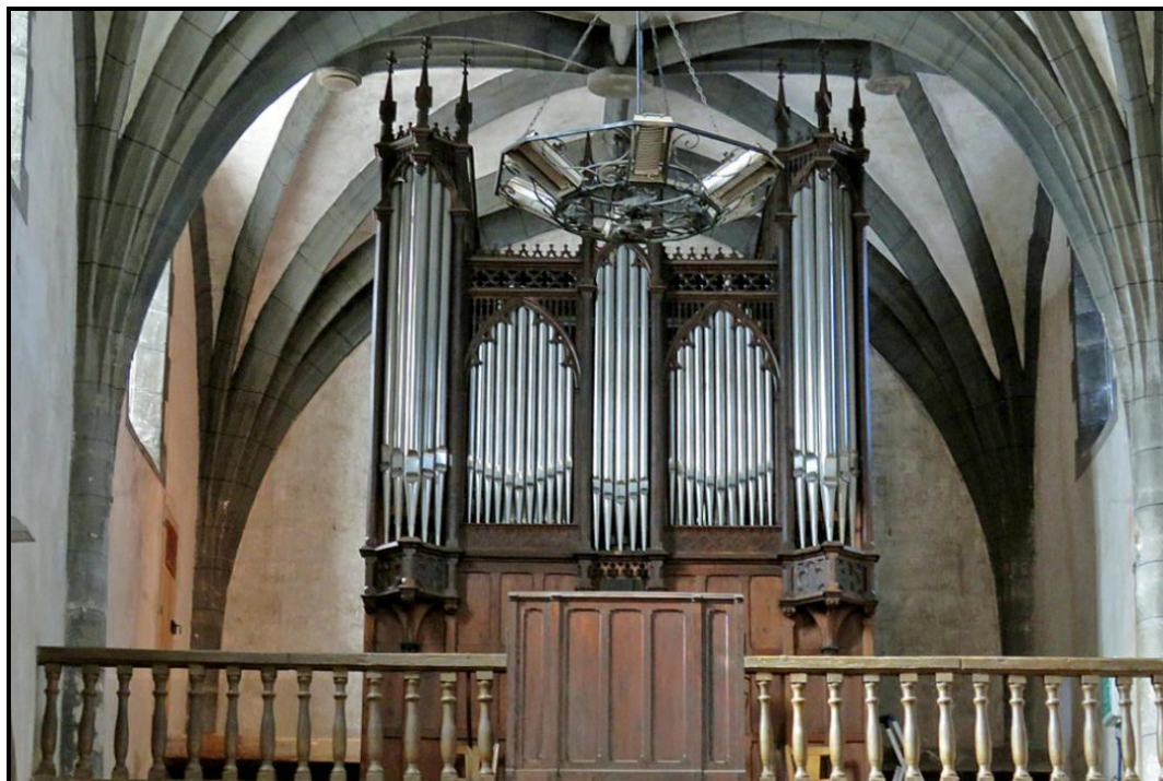
Eglise Saint-Etienne de VILLENEUVE-SUR-LOT (Lot-et-Garonne) 20 jeux - II/Péd

Orgue construit par Jules Barthélémy Magen d' Agen en 1867 et classé Monument Historique en 2009. En 2011-2012, la Manufacture Languedocienne de Grandes Orgues restaure complètement l'instrument en supprimant les ajouts de 1964. Inauguration, le 17 octobre 2012 par Jean-Claude Guidarini.